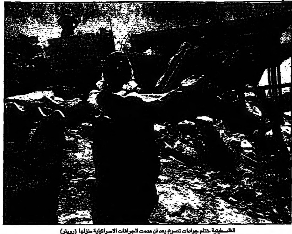
القتلى الفلسطينيين عظم جراحات تصرع بعد ان دممت الجرافات الاسرائيلية منازلها

القُدس - قال ياسر عرفات، زعيم حركة المقاومة الإسلامية (حماس)، في بيان أصدرته أمس الثلاثاء، بتفويض من اللجنة التنفيذية للحركة، إن العمليات الانتحارية التي قام بها مقاتلو كتائب القسام في الخليل، هي مجرد بداية لمزيد من العمليات الانتحارية التي ستقوم بها هذه الكتائب ضد الأهداف الإسرائيلية في الضفة الغربية المحتلة. وأضاف عرفات، في بيان صادر عن مكتبه في مدينة غزة، أن كتائب القسام ستواصل تنفيذ عملياتها الانتحارية في الضفة الغربية المحتلة، بهدف القضاء على الوجود الإسرائيلي في هذه المنطقة. وأكد عرفات، أن كتائب القسام ستواصل تنفيذ عملياتها الانتحارية في الضفة الغربية المحتلة، بهدف القضاء على الوجود الإسرائيلي في هذه المنطقة. وأكد عرفات، أن كتائب القسام ستواصل تنفيذ عملياتها الانتحارية في الضفة الغربية المحتلة، بهدف القضاء على الوجود الإسرائيلي في هذه المنطقة.